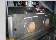
Tagliasacchi semiautomatica per nerofumo Semiautomatic bags cutter for carbon black