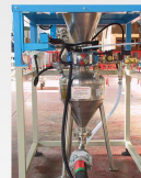
Trasporto e dosaggio Conveying and dosage