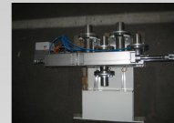
Valvola deviatrice 4 vie Diverter valve 4 way

LET IT HANDLE YOUR RAW MATERIALS WITH FLUID AIRSYSTEMS TECNOLOGIES!