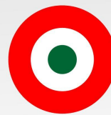
Fabbricato in Italia Made in Italy